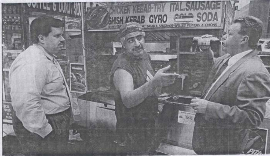
Zwei Geschäftsleute nutzen an der Wall Street die Gelegenheit für einen schnellen Imbiß.